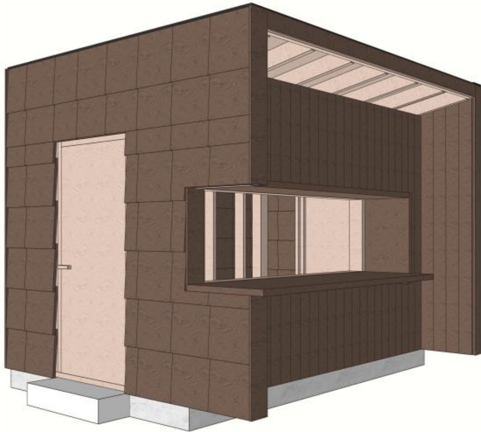
Visualisointikuva Prisman myyntikojusta.