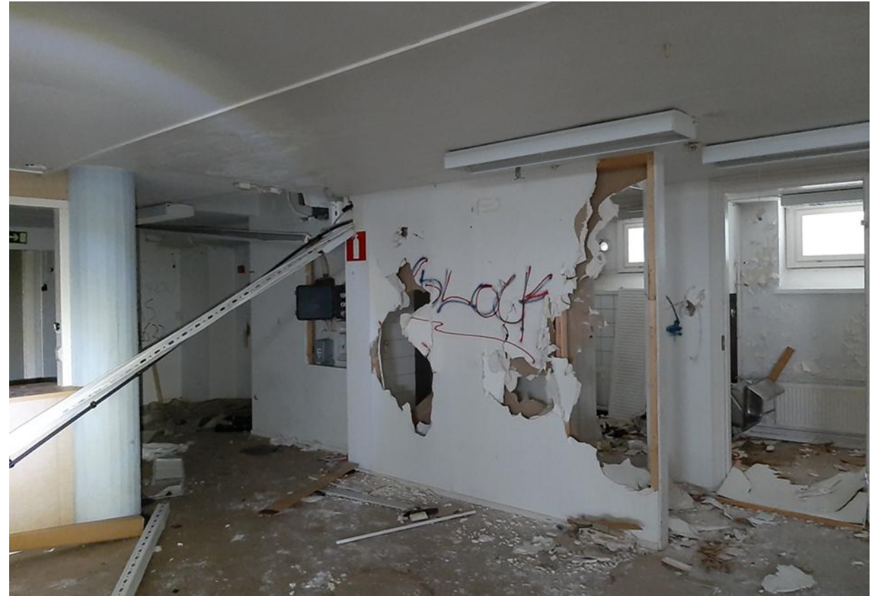
Purkukohteiden kunto vaihtelee.