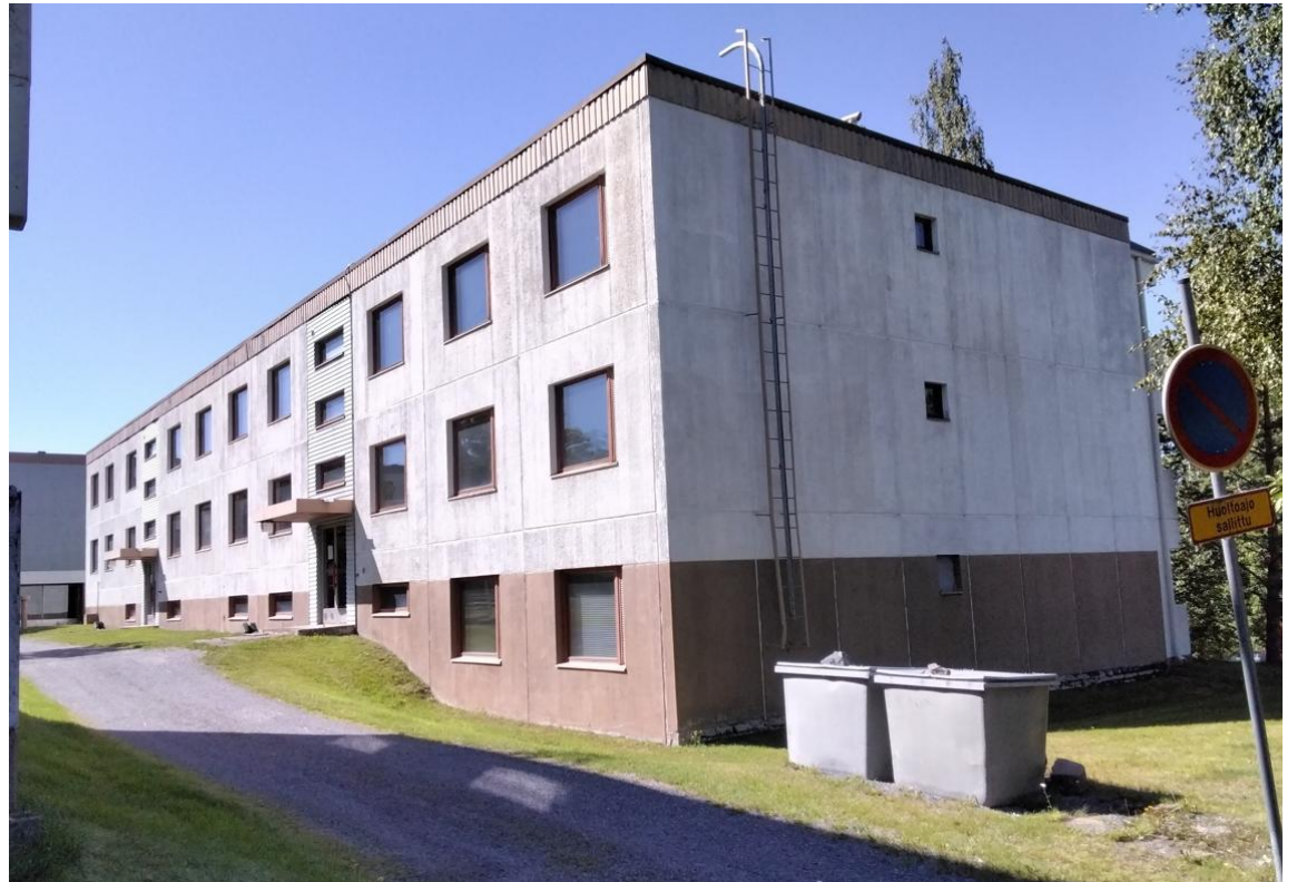
Vihuritaival 7 C-D.