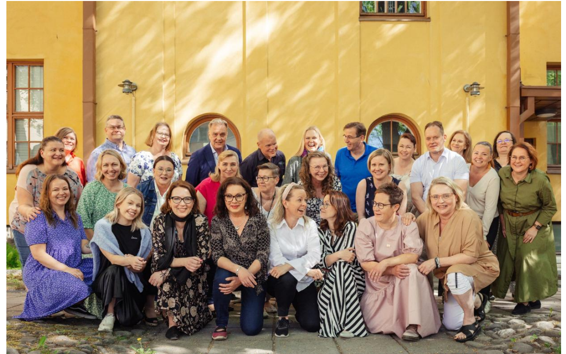
MikseiMikkelin henkilöstöä.