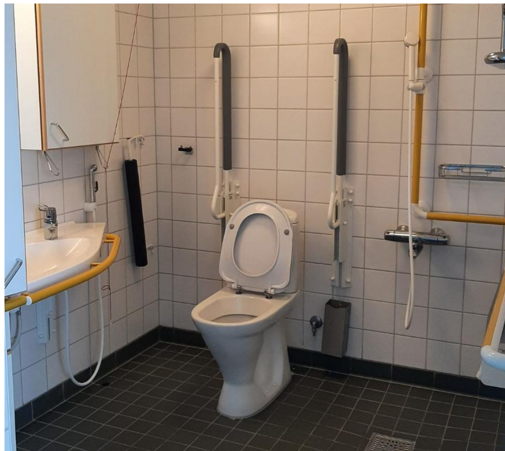
Joissain purkukohteissa isompia määriä uudelleenkäyttöön soveltuvaa materiaalia.