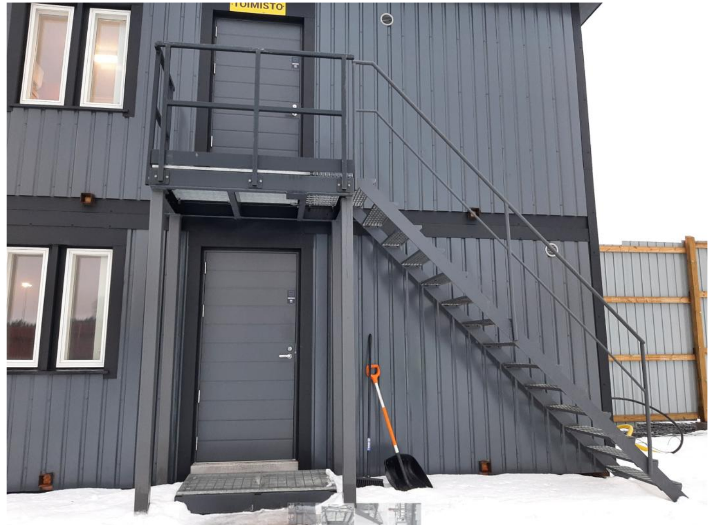
Uudelleenkäytetyt teräsportaatt Puijon Romun toimistolla.