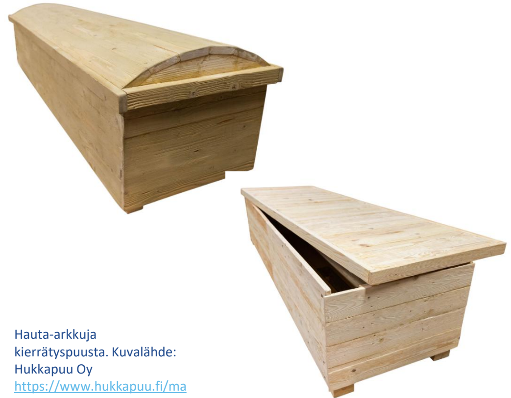
Hauta-arkkuja kierrätyspuusta.