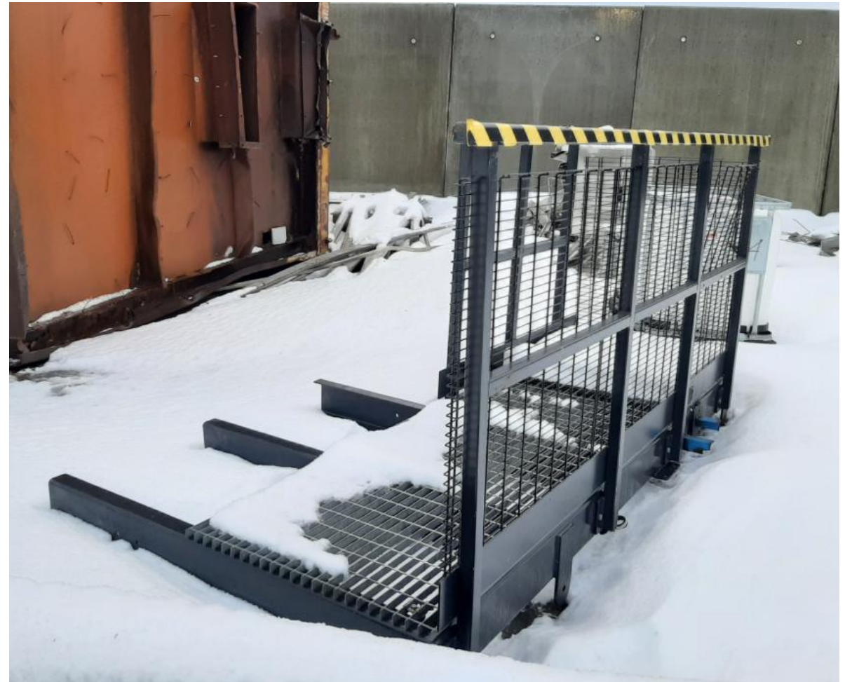
Teräsportaat entisellä sähkölaitoksella sekä purkukohteesta purettu kaiderakenne Puijon Romun varastotiloissa.