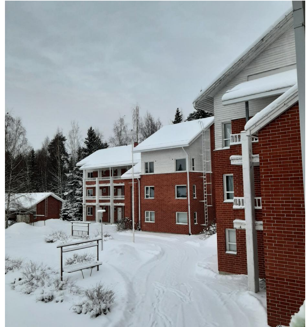
Kontionkadun opiskelija-asunnot.